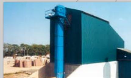
Eksempler på siloanlæg med kopelevator.