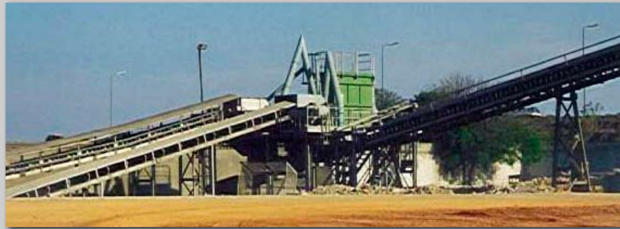
Komplet 400 t/h transportanlæg fra tippunkt til lagerfordeling udført for cementfabrik i Togo, Afrika.