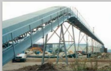
Landføringsanlæg for sten- og grusmaterialer.