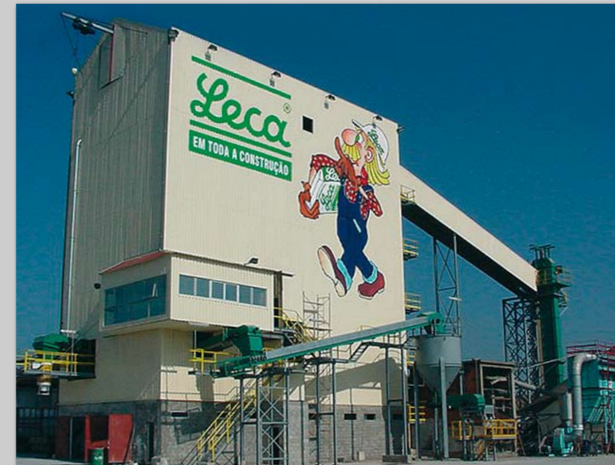
Komplet højsiloanlæg med indtag og materialefordeling på siloloft samt udlevering til lastbil.