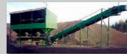
Eksempler på silotragte med materialeudtag.