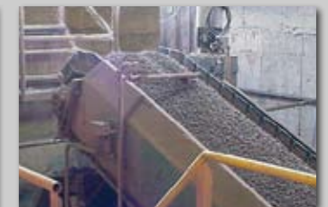
Stållamelbånd transporterer varme letklinker fra rotéovn og køler.