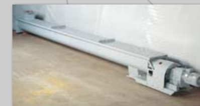
Specielle ophængslejer anvendes ved lange snegle.

Transportsnegle leveres som rørsnegle eller trugsnegle for transport af bulkmaterialer som f.eks. cement, kul, sand, aske, klinker m.m. Sneglene udføres i mange dimensioner og i materiale efter ønske.