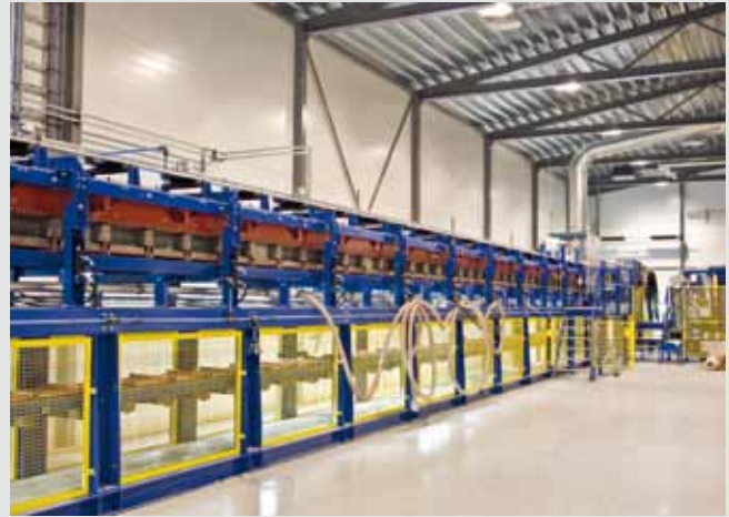
Fertigungslinie mit L-förmigen Schleppblechen